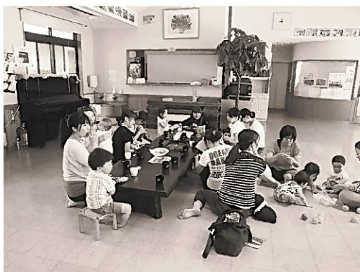
親子で集まってワイワイガヤガヤ笑顔が溢れるね！

この権利を人権と言いますが、これは私たちが幸福な生活を営んでいくために侵すことのできない普遍的権利であり日本国憲法によってすべての国民に保障されています。お互いの人権を尊重し、差別や偏見のない、本当に人権が尊重される社会を作っていくことが、一人ひとりに求められています。