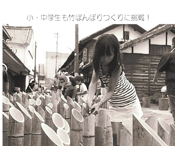
小・中学生も竹ぼんぼりづくりに挑戦!