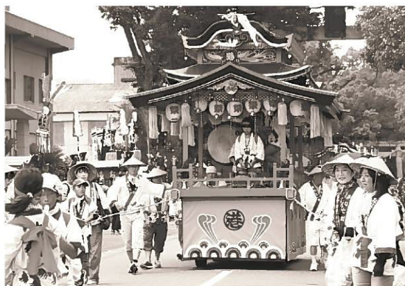
コンコンチキリンコンチキリン♪ ~臼杵の夏の音♪