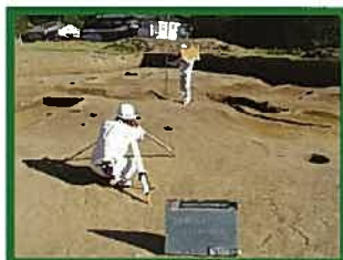
4.遺構平面図作成状況