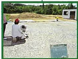
5.空中写真撮影状況