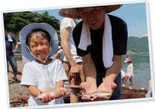
※具体的なスケジュールは、参加者確定後にお伝えいたします ※雨天の場合は室内でのアクティビティを予定しております

大分空港、JR大分駅までの送迎をさせていただきます(時間はこちらで指定させていただきます)。もちろん自家用車でのご参加も大歓迎。ツアー中の移動はこちらで用意した車での移動となります。