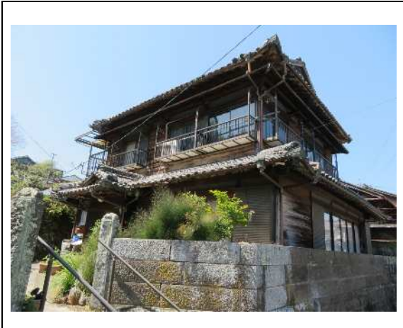
主要施設へのアクセス