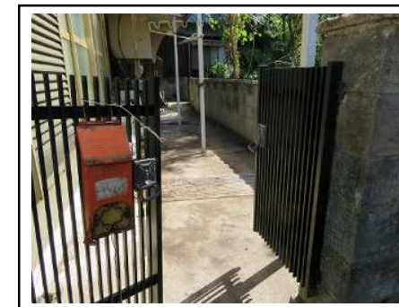
門・物干しスペース