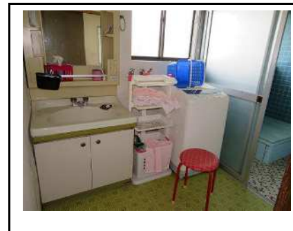
洗面台・洗濯機置き場