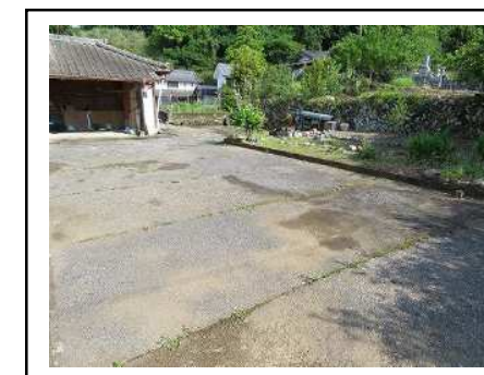
庭・駐車スペース