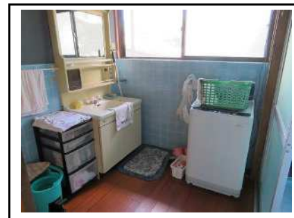
洗面所 & 洗濯機置き場