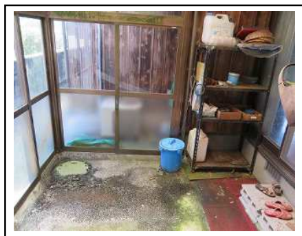
物置・物干しスペース